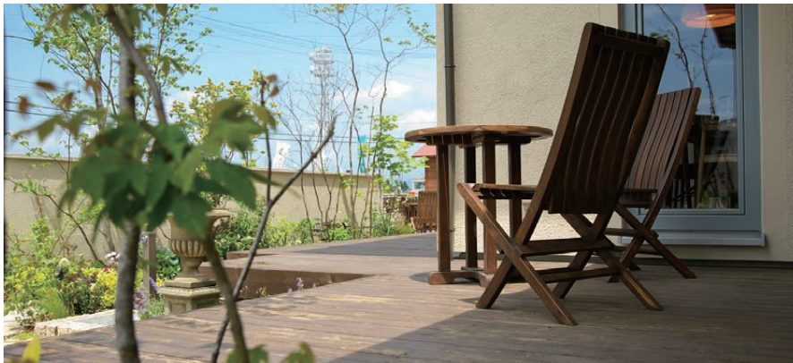
ウッドデッキ 天然木粉配合で、木の質感を備えつつ耐久性・耐候性に優れています。