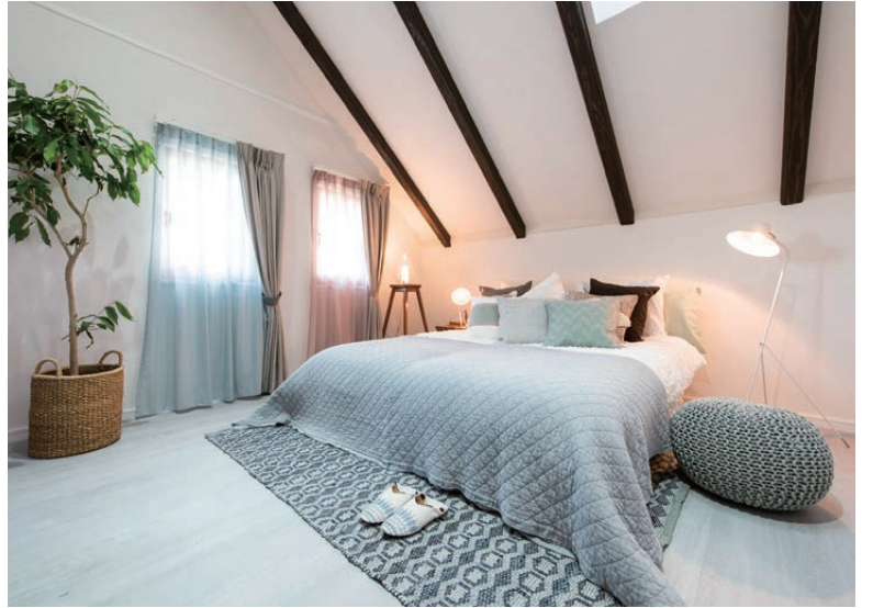
寝室 一日の始まりと終わりを迎える部屋は、リラックスできる雰囲気が大切です。