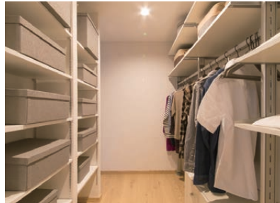
ウォークインクローゼット 収納スペースの大きさはもちろん、取り出しやすさにも配慮したレイアウトです。