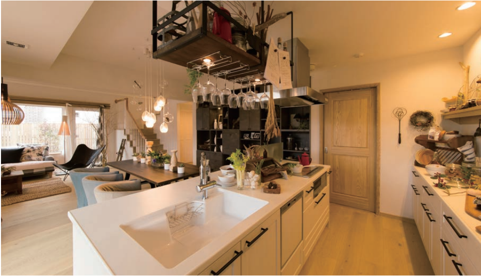
キッチン 炊事をしながら子どもたちとおしゃべり。顔の見えるオープンキッチンです。

内装には古材風の梁をかけてカフェ風に。三角の赤い屋根も住宅に見えない佇まい。暮らすことが楽しく、愛しさを育てていく住まいを、ぜひ会場でご覧ください。