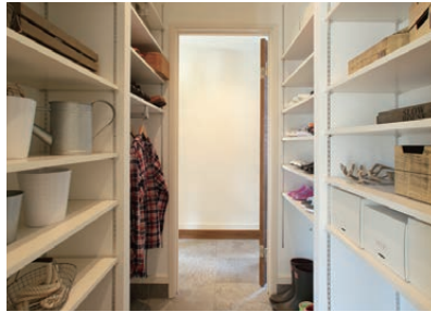
シューズルーム 便利な通り抜けタイプ。靴を選んだらそのまま外出できます。