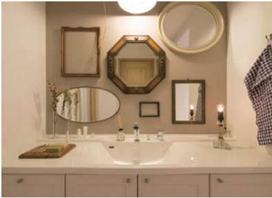
サニタリー リビングと同じく快適な温度差バリアフリー仕様。幅広い世代に使いやすく。