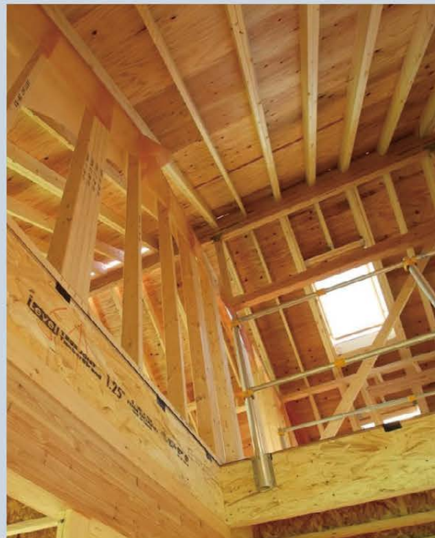
※掲載されている写真はイメージです。