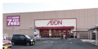
イオン一関店 徒歩11分(900m)