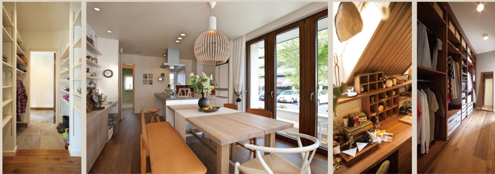
※掲載されている写真はイメージです。