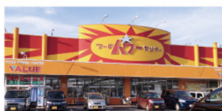
フードパワーセンターバリエール 徒歩5分(400m)