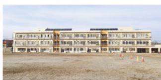
山目小学校 徒歩10分(800m)