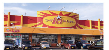
フードパワーセンターバリエール 徒歩5分(400m)