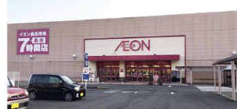
イオン一関店 徒歩11分(900m)