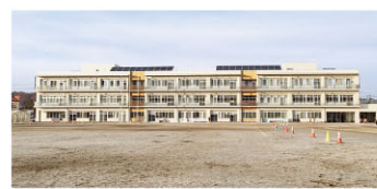
山目小学校 徒歩10分(800m)