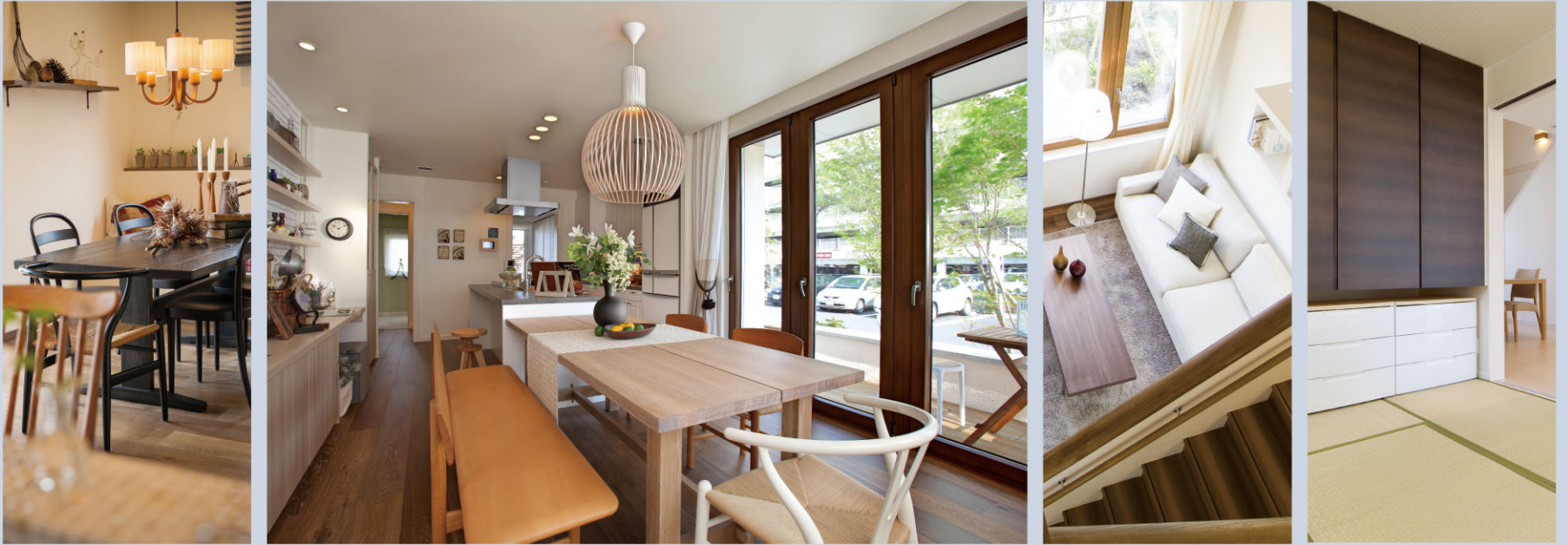
※掲載されている写真はイメージです。