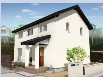
※掲載されている写真はイメージです。