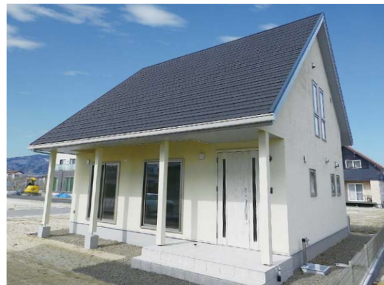
※掲載されている写真は実際の建物です。

1F床面積 59.62㎡(17.99坪) 2F床面積 46.37㎡(13.99坪) 延べ床面積 105.99㎡(31.99坪)