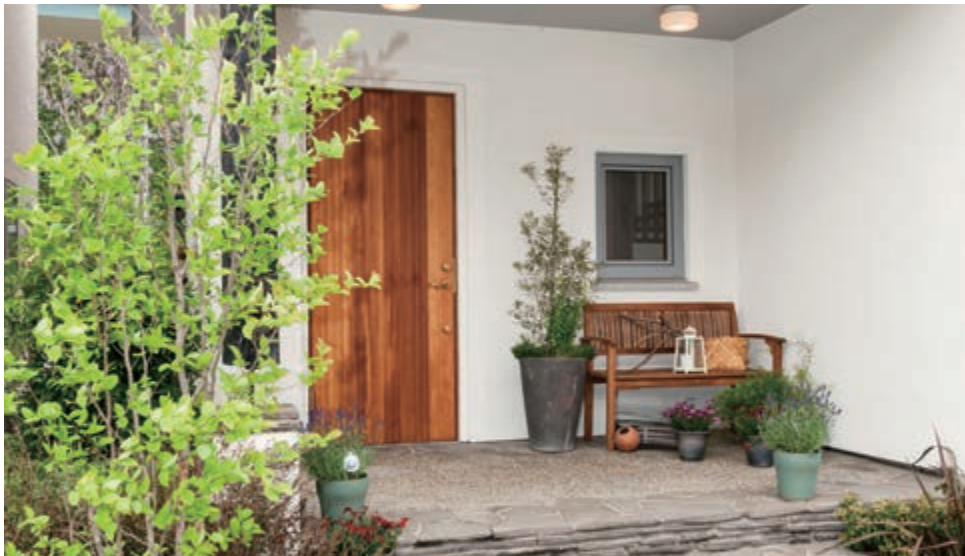
玄関 ポーチの大きな屋根が雨や日差しをさえぎります。自転車も入れる広さです。

全館空調デシカ(ダイキン製)を採用し、室温調整は勿論、除湿・加湿も自動で行うので、ジメジメした梅雨時期も快適に過ごせます。