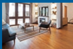
無垢板のフロア 無垢の木の風合いがもたらす心地よさはそのままに、反り・くりを軽減させた3層構造の「三層フロア」