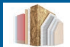
外張り断熱システム 劣化しにくく外部に湿気を逃す特性もある、日本の気候に適した「アルセコ外張り断熱システム」