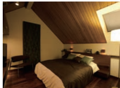
寝室 一日の始まりと終わりを迎える部屋は、リラックスできる雰囲気が大切です。