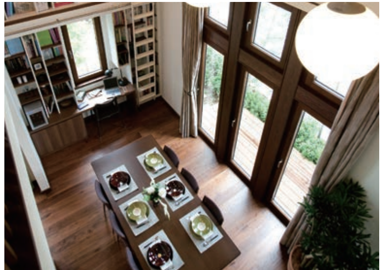
ダイニング 余裕を持たせた空間設計が、家族や仲間とのコミュニケーションを促します。