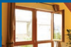
木製三層ガラス窓 換気性・防犯性・デザイン性を追求した、ヨーロッパ生まれの「木製三層ガラス窓 D-fenster nature」