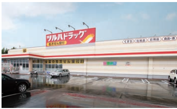
■ツルハドラッグ野沢店 約750m(徒歩約9分)