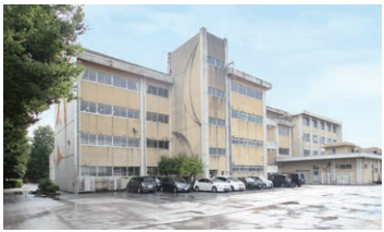
■晃宝小学校 約450m(徒歩約6分)