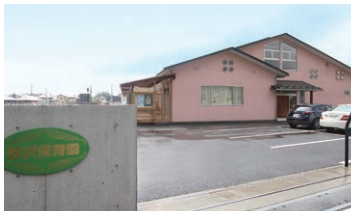
■野沢保育園 約50m(徒歩約1分)