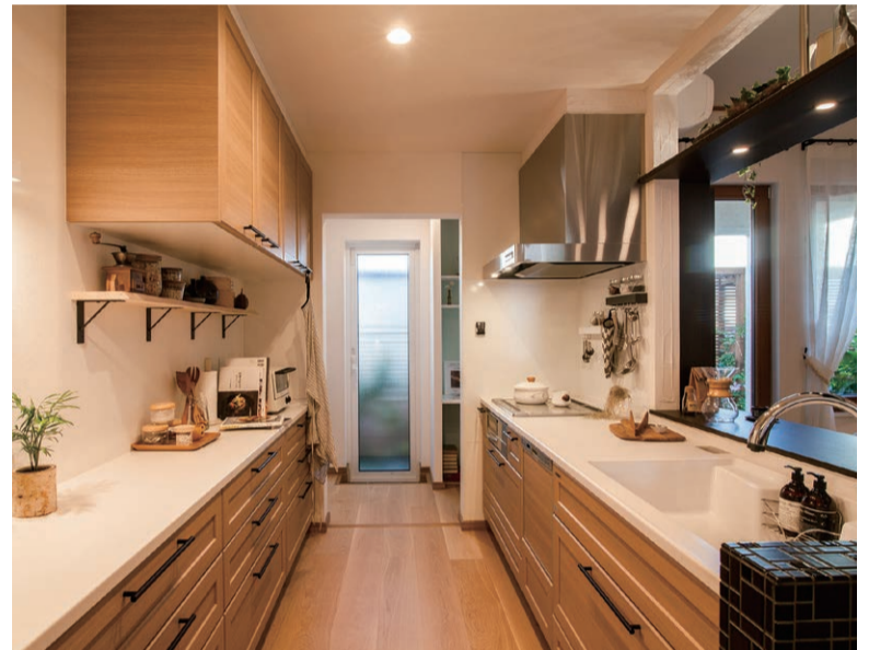
キッチン 水まわり、家電の配置、収納にいたるまで使いやすさを心掛けたレイアウトです。