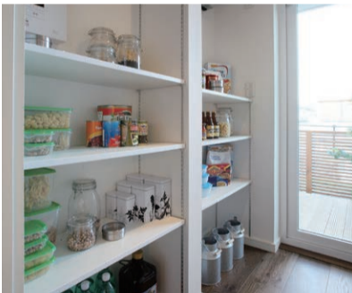
パントリー 食事の準備を助けてくれる場所。 小さな手間の差が味の違いにつながります。