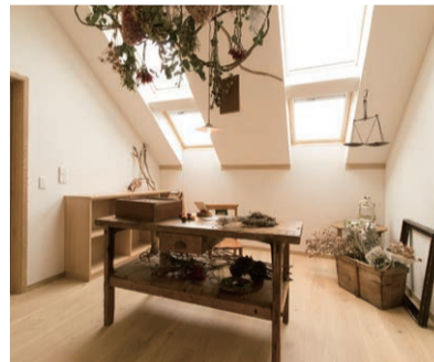
オールルーム 家族とのつながりを感じられ、 書斎として使用できる空間になっています。