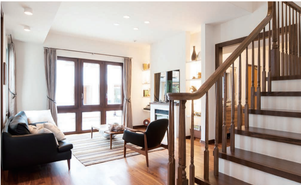
リビング 空間に変化をもたらす階段デザイン。飽きのこない間取りのための配慮です。

吹き抜けを生かして設けられた空間は、声や物音で家族の気配が感じられ、自然と家族の絆を育みます。