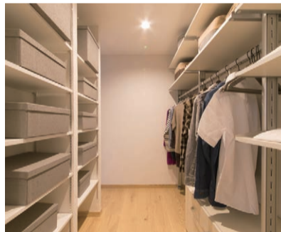
WIC 収納スペースの大きさはもちろん、 取り出しやすさにも配慮したレイアウトです。