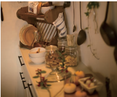
パントリー 食事の準備を助けてくれる場所。 小さな手間の差が味の違いにつながります。