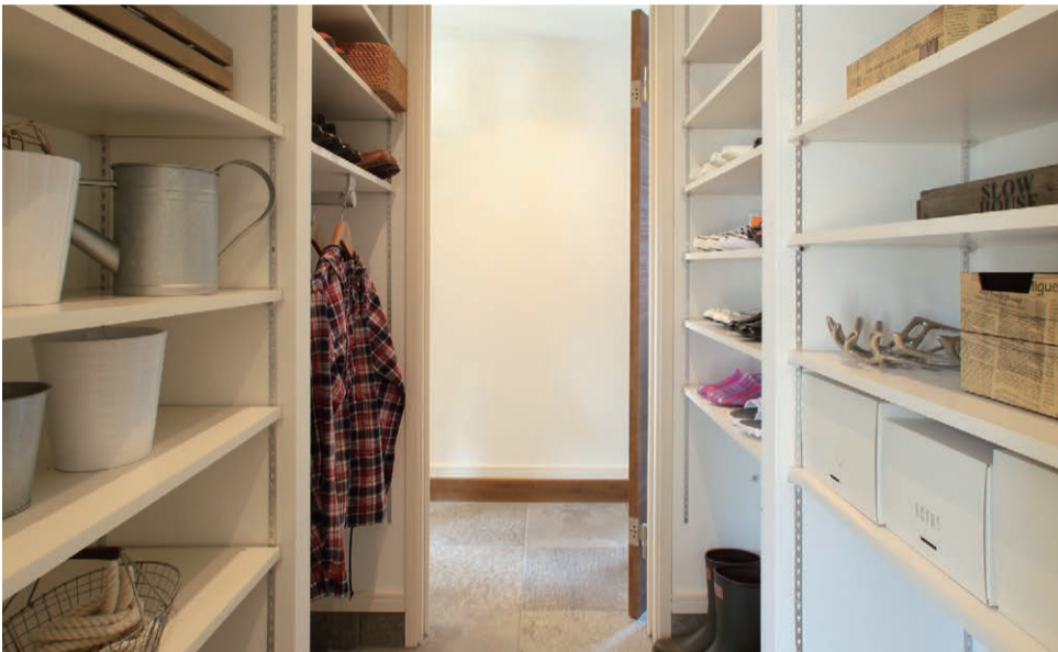
シューズルーム 便利な通り抜け構造となっているため、靴を選んだらそのまま外出できます。