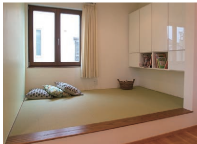
たたみコーナー 小上がり仕様の和空間。いすに座る感覚で、 フロアからラクラクのぼりお座りできます。