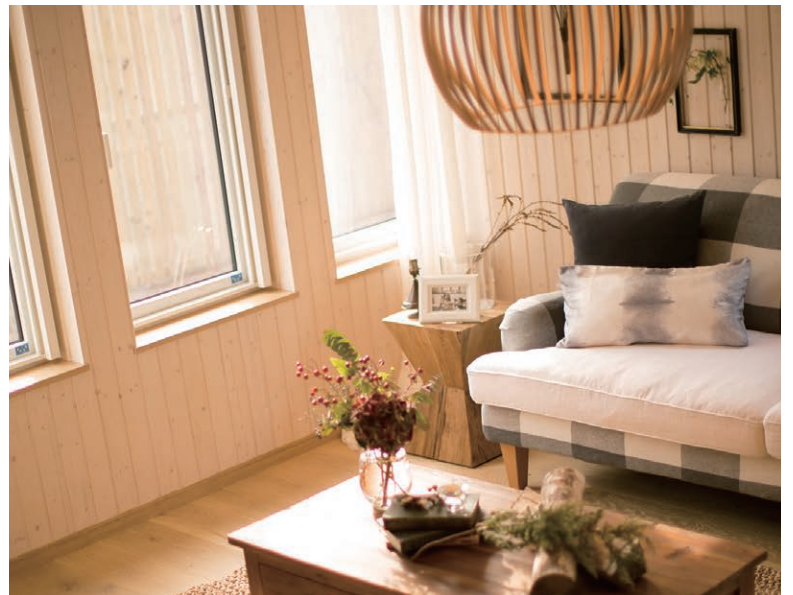
リビング 家族が集う団らんスペースには、過ごしやすい広さや明るさが欠かせません。