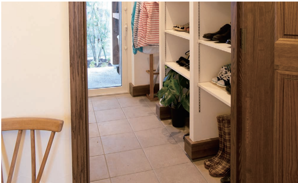
シューズルーム 革靴、ブーツ、スニーカー…たくさんの靴を収納できる大きなスペースです。