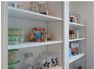
パントリー 食事の準備を助けてくれる場所。 小さな手間の差が味の違いにつながります。