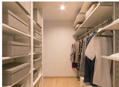
WIC 収納スペースの大きさはもちろん、 取り出しやすさにも配慮したレイアウトです。