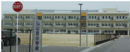
山目小学校 徒歩10分(800m)