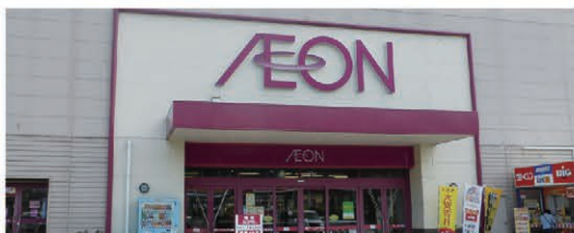
イオン一関店 徒歩11分(900m)