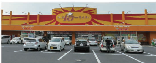
フードパワーセンター バリュー 徒歩5分(400m)