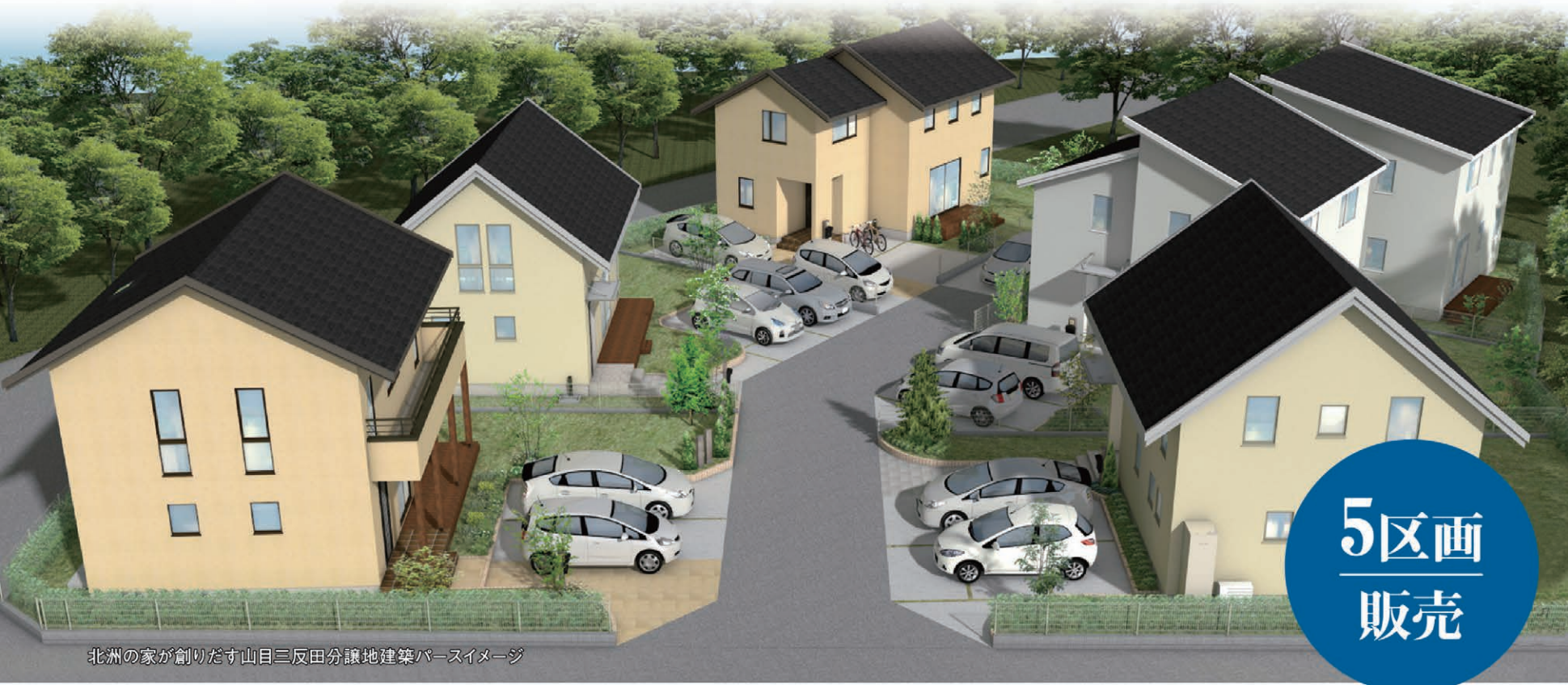
北洲の家が創りだす山目三反田分譲地建築パースイメージ