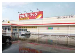
ツルハドラッグ野沢店 約750m(徒歩約9分)