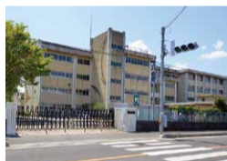
昇宝小学校 約450m(徒歩約6分)