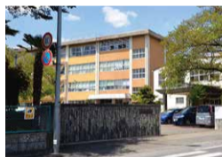
国本中学校 約1,800m(徒歩約23分)