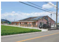
野沢保育園 約50m(徒歩約1分)