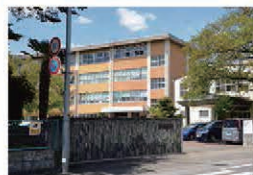
国本中学校 約1,800m(徒歩約23分)