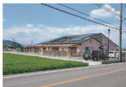
野沢保育園 約50m(徒歩約1分)