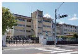
鬼宝小学校 約450m(徒歩約6分)