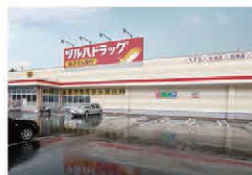
ツルハドラッグ野沢店 約750m(徒歩約9分)