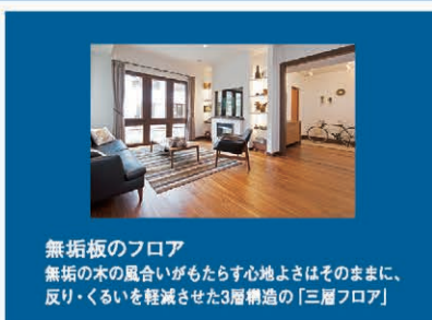
無垢板のフロア 無垢の木の風合いがもたらす心地よさはそのままに、反り・くいを軽減させた3層構造の「三層フロア」