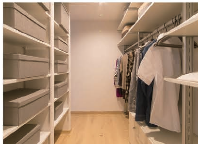
WIC 収納スペースの大きさはもちろん、取り出しやすさにも配慮したレイアウトです。