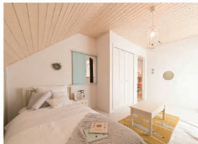
子供部屋 子どもの心身をはぐむ場所。成長しても使いにくならないような設計を。