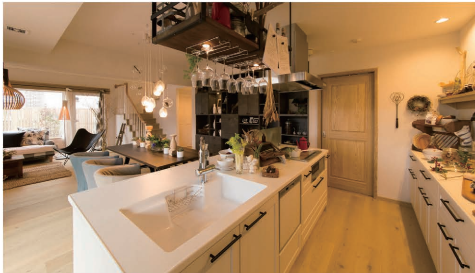
キッチン 炊事をしながら子どもたちとおしゃべり。顔の見えるオープンキッチンです。

ご夫婦仲良く並んで食事の準備や後片付けが出来るキッチン、吹き抜けからダイニングに差し込む陽の光が自然と家族の表情を明るくし、コミュニケーションが取りやすい空間とすることで笑顔あふれる楽しい住まいを実現。無垢の床材、板張り天井、左官仕上げの塗り壁など自然素材の温もりのある空間を演出しています。