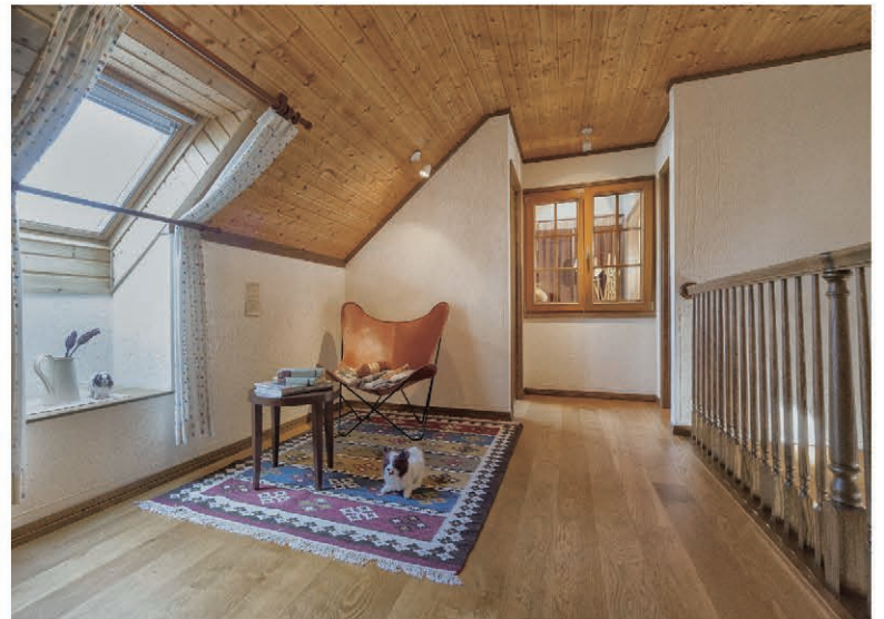
オールルーム 吹き抜けを生かして設けられた空間。声や物音で家族の気配が感じられます。