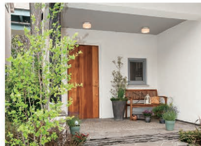
玄関 ポーチの大きな屋根が雨や日差しをさえぎります。自転車も入れる広さです。