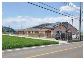
野沢保育園 50m(徒歩約1分)