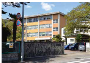
国本中学校 約1,800m(徒歩約23分)