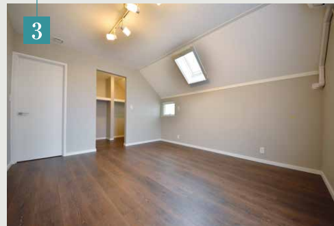
●主寝室 大きなウォークインクローゼットを併設した主寝室。勾配天井が空間に変化と落ち着き、安心感をもたらします。天窓、地窓は光と風を取り入れて、毎日の穏やかな眠りと目覚めをサポートしてくれます。