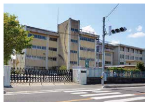
晃宝小学校 約450m(徒歩約6分)