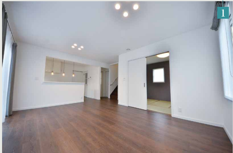
●リビング 動線の外側でありながらその一部に配置されたリビングは、落ち着きがありながらも家族をごく自然に迎えます。視線の伸びは家族の一体感も創り出します。