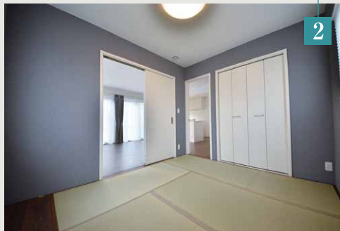
●和室 子供の遊び場、客間、将来の寝室。ライフステージの変化にフレキシブルに対応する和室は、将来にわたり大活躍してくれます。