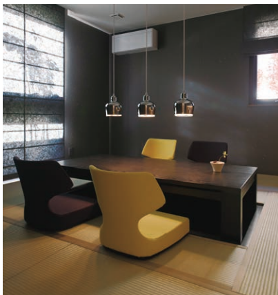
たたみコーナー 小上がり仕様の和空間。いすに座る感覚で、 フロアからラクラクのぼりおりできます。