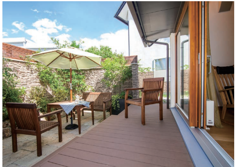
テラス 広々としたテラスで、憧れのガーデンパーティーを開いてみませんか。