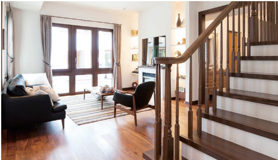
リビング 空間に変化をもたらす階段デザイン。飽きのこない間取りのための配慮です。

昔の住まいにはよくあった「縁側」のような場所。お庭で子供達が楽しく遊んでいる様子を近くで眺めたり、庭いじりの休憩をしたり。天気の良い日は、そこで食事をしながら家族団らんもできる、特別な場所が見所です。