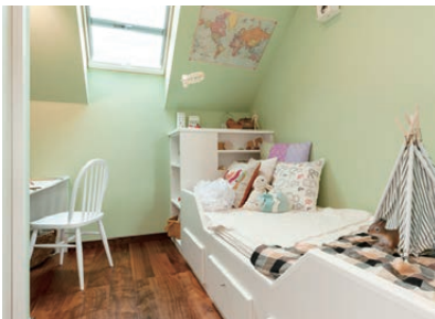
子供部屋 子どもの心身をはぐむ場所。成長しても使いにくならないような設計を。