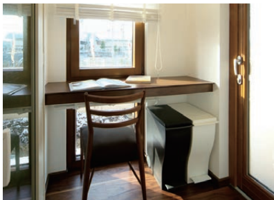
M'sコーナー ママの小スペースです。家事の合間に、レシビ検索や家計簿など使い方は様々です。