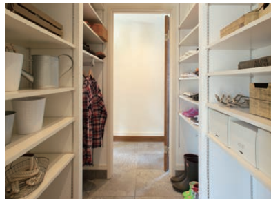
シューズルーム 革靴、ブーツ、スニーカー... たくさんの靴を収納できる大きなスペースです。