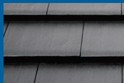
陶器瓦 瓦の耐用年数は50年以上。 耐久性と美しさを兼ね備えた「瓦屋根」