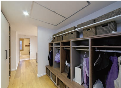
ファミリークローゼット ご家族それぞれが収納できる スペースとなっております。