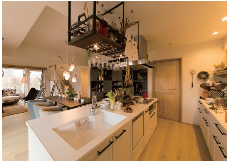
キッチン 炊事をしながら子どもたちとおしゃべり。顔の見えるオープンキッチンです。