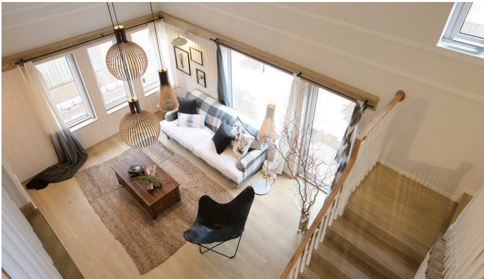
リビング 家族が集う団らんスペースには、過ごしやすい広さや明るさが欠かせません。

ご家族が集うLDKに洋室を隣接させたプランニング。洋室を、お子様が遊ぶスペースとして、ご家族それぞれが使えるスペースとして設けたことで、のびのびと楽しめるリビングまわりの空間となります。