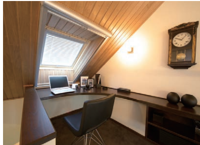
書斎 仕事や趣味に没頭する場。 そんな部屋があると毎日にメリハリが生まれます。