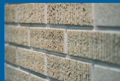
乾式タイル 外壁は、家の耐久性と美しさを決める最も重要な部分です。永く美しさを保つ自然素材の「タイル」