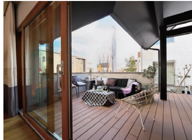
ウッドデッキ 軒下空間のウッドデッキで、 バーベキューを楽しみませんか。