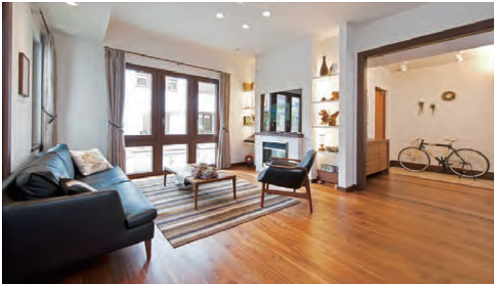
リビング 家族が集う団らんスペースには、過ごしやすい広さや明るさが欠かせません。

敷地は公園と遊歩道で囲われた立地。派手さはないが、存在感ある大屋根の家はこれから木々と共に成長するデザイン。周りの目線を気にせずくつろげる2階リビングは、屋根に包まれる落ち着き感があり、ついうたた寝したくなる空間。ぜひ、直接ご体感ください。