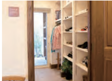
シューズルーム 革靴、ブーツ、スニーカー…たくさんの靴を収納できる大きなスペースです。