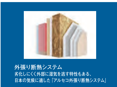
外張り断熱システム 劣化しにくく外部に湿気を逃す特性もある、日本の気候に適した「アルセコ外張り断熱システム」