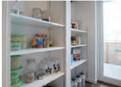
パントリー 食事の準備を助けてくれる場所。小さな手間の差が味の違いにつながります。