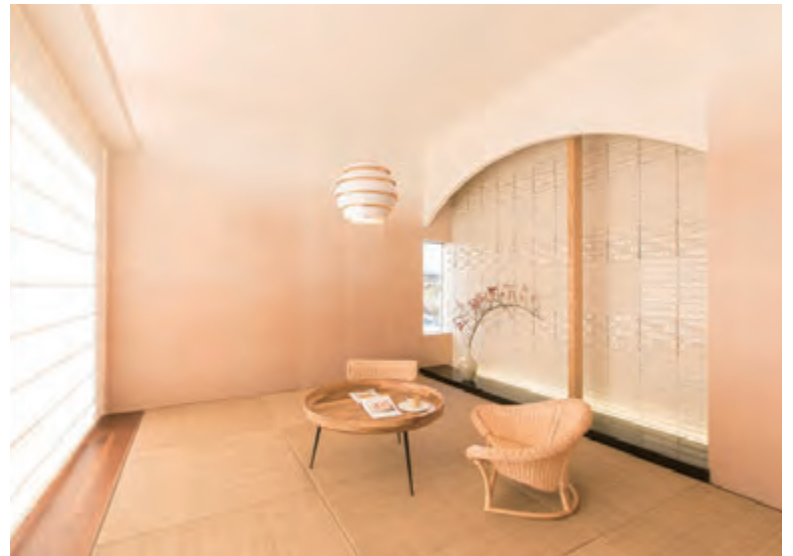
個別和室 イグサの香りと和の落ち着き。この国ならではの情緒を感じさせる部屋です。