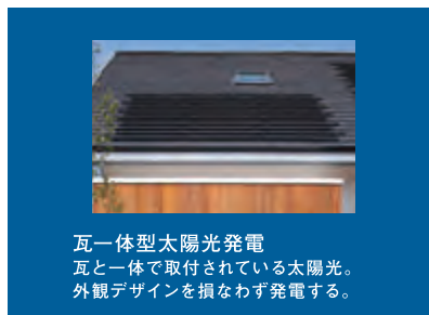
瓦一体型太陽光発電 瓦と一体で取付されている太陽光。外観デザインを損なわず発電する。