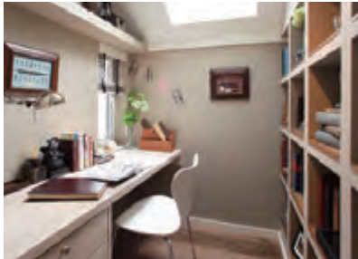
書斎 仕事や趣味に没頭する場。そんな部屋があると毎日にメリハリが生まれます。