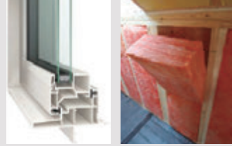
高性能 複層ガラスサッシ 高性能 グラスウール壁断熱 ※ウスコの2019年～2020年物件の平均値

夏も冬も快適に過ごせる高気密高断熱住宅。外の暑さ・寒さの影響を受けにくく、冷暖房費の節約にもつながります。