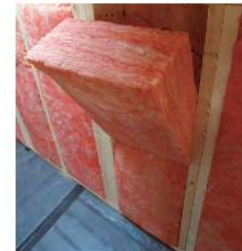
高性能 グラスウール壁断熱