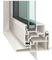
高性能 複層ガラスサッシ

夏も冬も快適に過ごせる高气密高断熱住宅。外の暑さ・寒さの影響を受けにくく、冷暖房費の節約にもつながります。