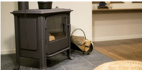
ストーブ ステージのように設えたストーブコーナー。 2階にも暖房が行きわたる効果もあります。