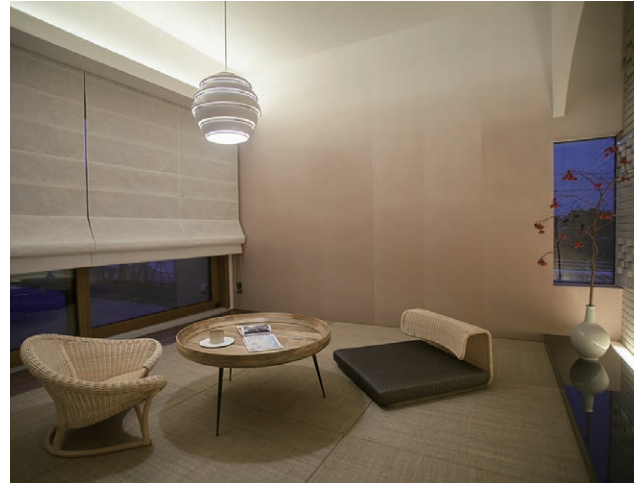
和室 暮らしにゆとりと落ち着きを加える和の空間。収納も多く用意し実用性も備える。