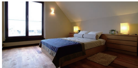
勾配寝室 落ち着きを重視したい主寝室は、勾配天井にすることで実現。