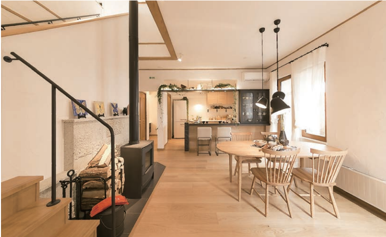
リビング LDKは、お庭が視界に入るように窓の位置を配慮することで、より季節を感じる空間。

その空間から眺める丹精を込めたお庭。暮らすほどに愛着が湧く住まいが完成いたしました。皆様のお越しをお待ちしております。